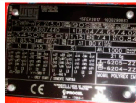
Placa de identificação do motor

Para todas as tensões utilizar botoeira de acionamento e contator de corrente superior a 10A, próprios para esse tipo de aplicação (motor).